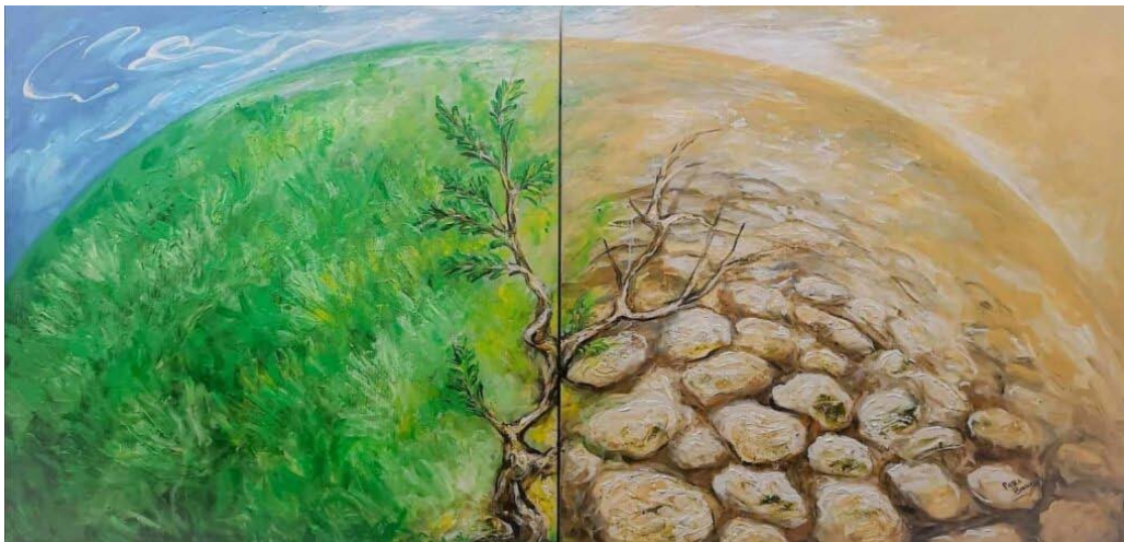
Luce e sostenibilità: opera di Pietra Barrasso. L'arte al servizio dell'ambiente

Nascita ed evoluzione del concetto di “sostenibilità ambientale” nell'arte: l'armonia che fa riflettere